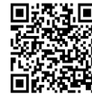
プラスシードの アカウント登録QRコード