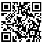
本校『プラスシード』の トップページQRコード